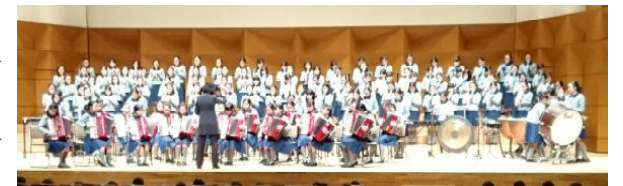
【展覧会の絵(シビックホール)】

さて、演奏はというと、6年生が単独で出演していたのは聖心だけでしたが、最高学年であるということも、差し引いても、迫力のあるとても素晴らしい演奏でしたので、会場から大きな拍手をいただきました。