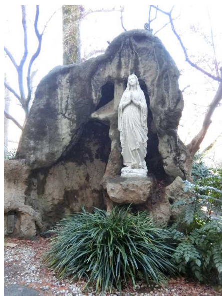
本校のルルドのマリア様

「ルルドの水」は万能薬や奇跡の水ではありません。しかし、多くの人々が長いあいだ聖母への尊敬を込めて祈ってきた場所の水であり、神への祈りと信頼が込められた水とも言えるでしょう。ある時、ルルドを訪れた方が大切に持ち帰り、病気の方がいらしたらお分けくださいと、私にもくださいましたので、大切に保管し、病気の方にお分けすることがあります。この水が、聖母が教えてくださったように、神さまは決して病者を見捨てることはない、いつも共にいてくださるという信頼を思い起こす、祈りの助けとなると信じるからです。また、この水と共に祈るとき、いのちへの信頼と希望が見いだせると思うからです。