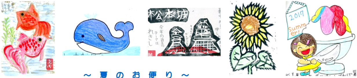
～ 夏のお便り ～

9月以降も様々な行事が予定されています。保護者の皆様には、これまでと同様にご理解ご協力をよろしくお願いいたします。